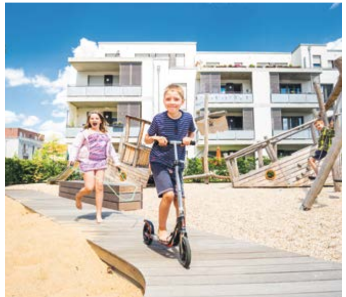
Nordwohnquartier Düsseldorf