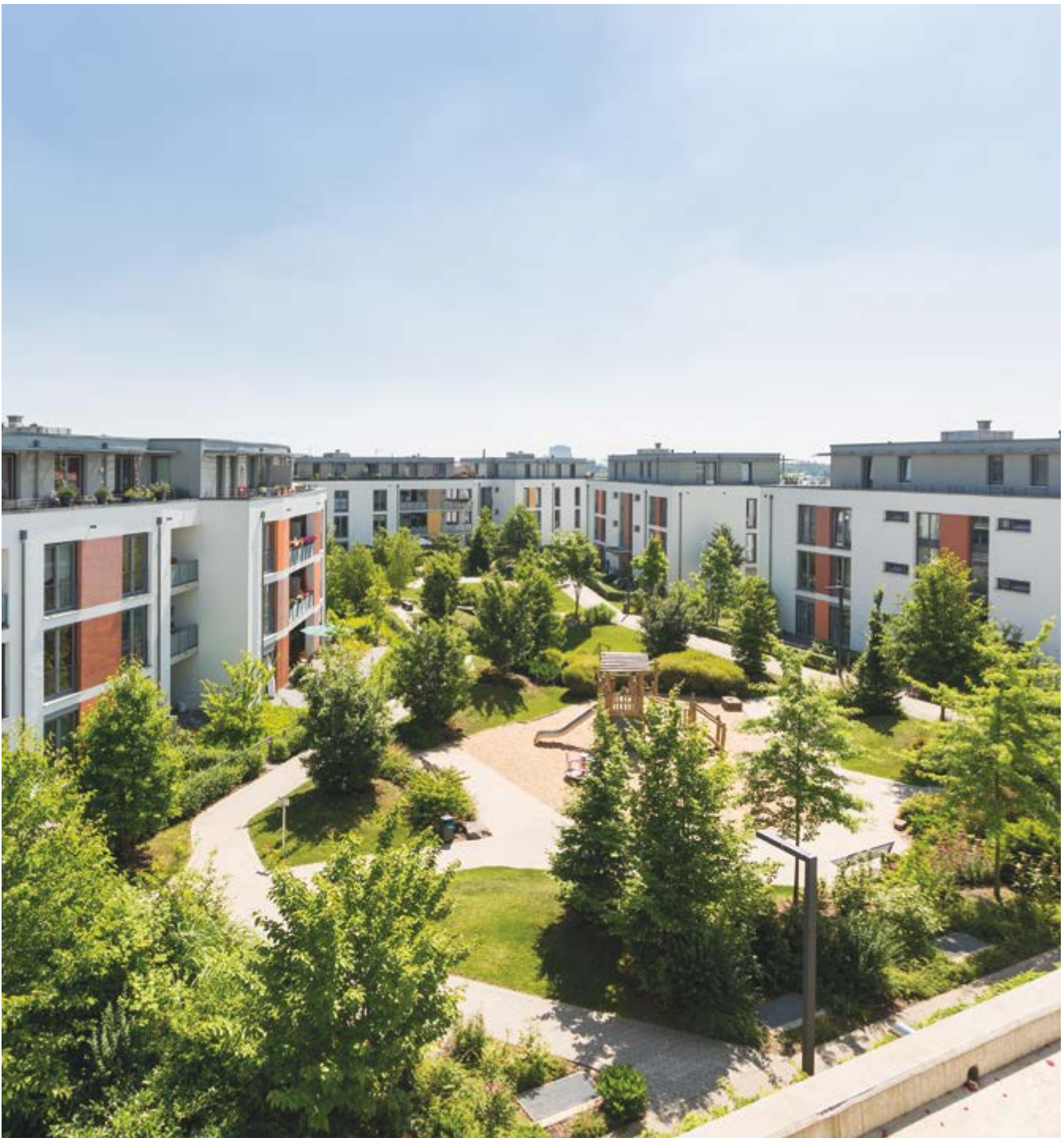
Kirschblüten-Carré Köln, Foto: © WSG Wohnungs- und Siedlungs-GmbH